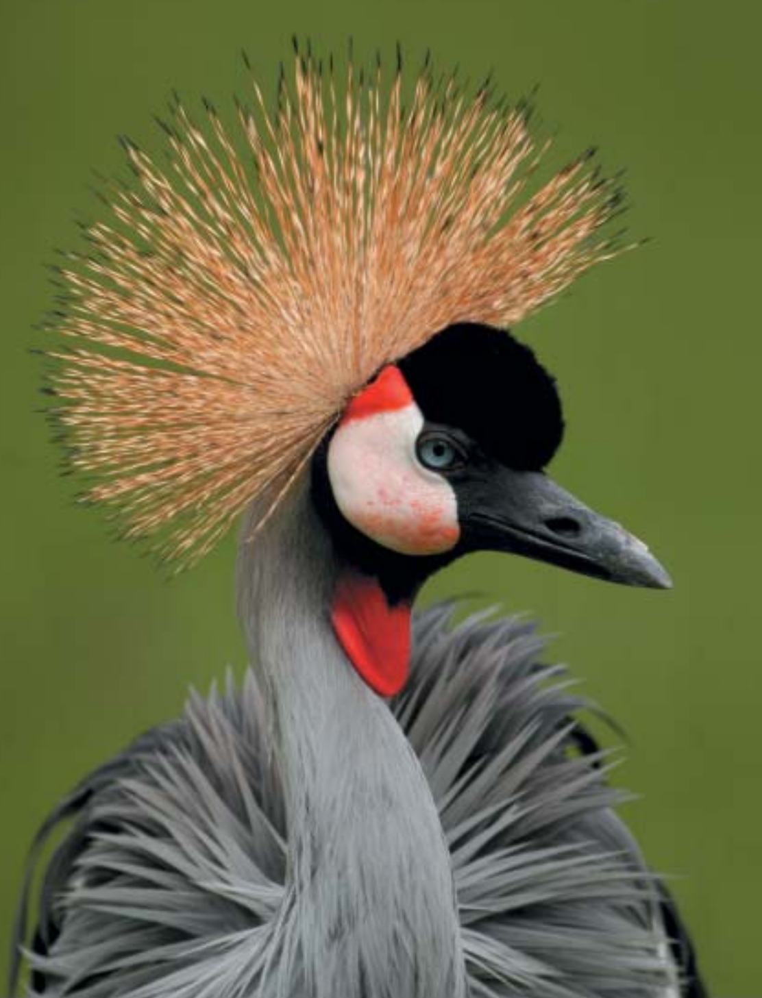
Obálka: 1. strana - Tygr ussurijský ( Panthera tigris altaica ), Amur Tiger 2. strana - Jeřáb královský ( Balearica regularum gibbericeps ), Red-crowned Crane 4. strana - Orchidej ( Cleisto crochetii )